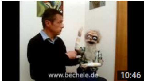
Herr Becheles Unfall 10min 46 sek. Mundart schwäbisch

Falls Sie sich durch das Projekt inspirieren lassen selbst etwas ähnliches, auf Basis der auf bechele.de bereitgestellten Software oder Hardwareinfo, zu bauen, so würde ich mich freuen, wenn Sie mir nach Abschluss des Projekts, einen Videolink oder Bilder ihres Projektes zukommen lassen würden. Nach Prüfung werde ich die Infos auf Wunsch gerne an geeigneter Stelle auf bechele.de veröffentlichen.