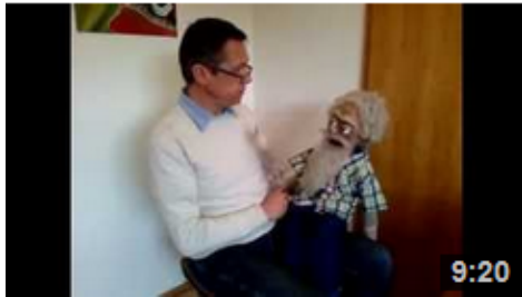
Herr Becheles Geburtstag 9min 20 sek. Mundart schwäbisch.