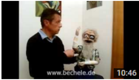
Herr Becheles Unfall 10min 46 sek. Mundart schwäbisch

Falls Sie sich durch das Projekt inspirieren lassen selbst etwas ähnliches, auf Basis der auf bechele.de bereitgestellten Software oder Hardwareinfo, zu bauen, so würde ich mich freuen, wenn Sie mir nach Abschluss des Projekts, einen Videolink oder Bilder ihres Projektes zukommen lassen würden. Nach Prüfung werde ich die Infos auf Wunsch gerne an geeigneter Stelle auf bechele.de veröffentlichen.